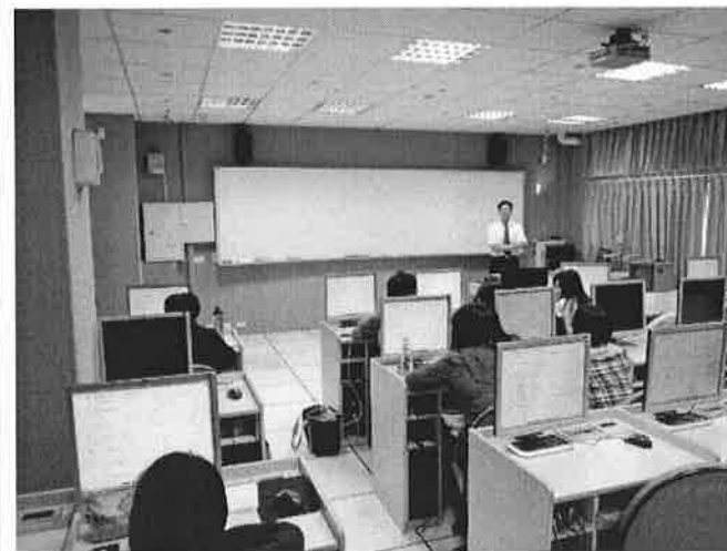
1021030 日語能力檢定證照輔導班上課情形