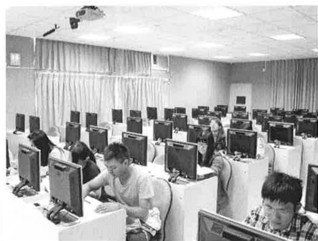
1021023 日語能力檢定證照輔導班上課情形