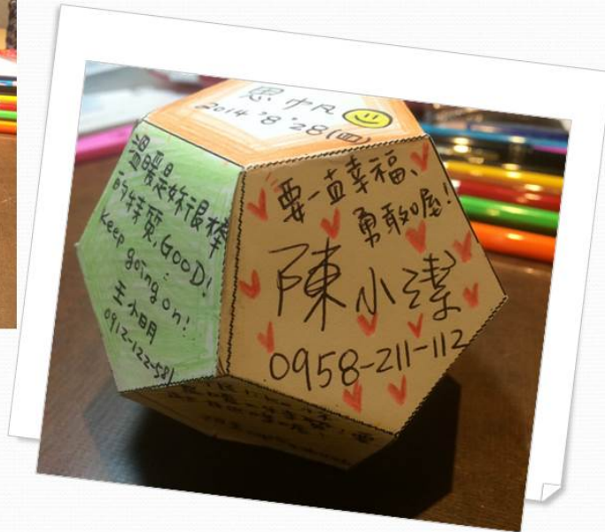
生涯圓滿球 完成示意圖