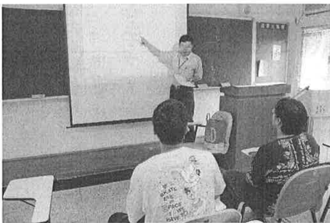
1030514-日語能力檢定證照輔導班-基礎文法班 上課情形