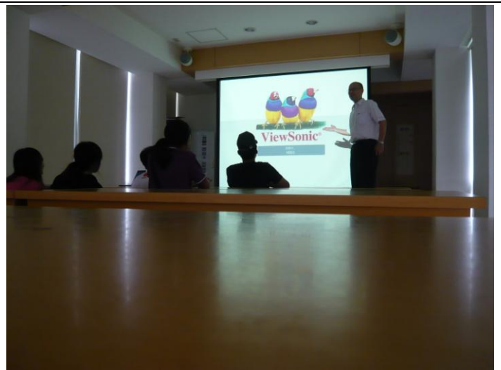
1030604 日語綜合能力輔導班上課情形