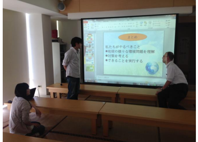
1030430 日語綜合能力輔導班上課情形